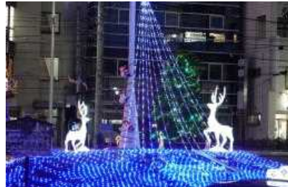
【イルミネーション】

本塩釜駅前では「しおがまがんぼっページェント」が開催されており、花時計周辺は4万個を超えるイルミネーションで彩られています。オープニングセレモニーでは、本校の吹奏楽部がミニコンサートを行いました。当日は、気温が低く大変な寒さでしたが、クリスマスソングを演奏し、セレモニーに華を添えました。