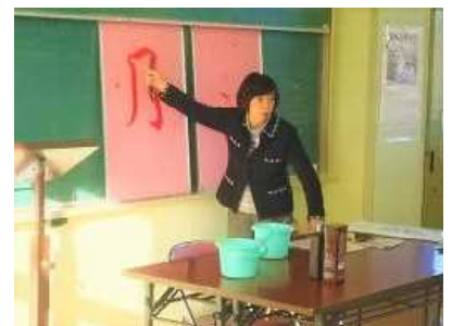
【書写の授業の様子】