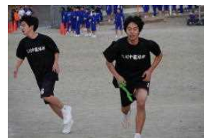
【バスケAたすきリレー】