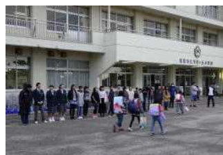
【小中合同あいさつ運動】

11月11日(月)から15日(金)に、月見ヶ丘小学校と合同のあいさつ運動を行いました。今年度は、玉川小学校でも11月12日(火)13日(水)の2日間実施しました。生徒会役員が小学校の計画委員の皆さんと共に、登校する小学生にあいさつをしました。元気にあいさつすることで、小学生との絆が深まり、気持ちの良い朝を迎えることができた1週間となりました。