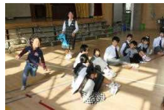
【玉川小ふれあいの時間】