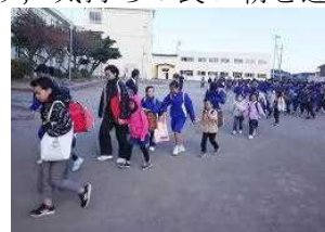
【小中合同下校訓練】

11月14日(木)は、火災避難訓練後に、小中合同の下校訓練を実施し、命を守る行動や防災について考える日となりました。風が強く、とても寒い中での避難訓練となりましたが、真剣に取り組み、下校訓練では小学生をよくリードしながら参加していました。