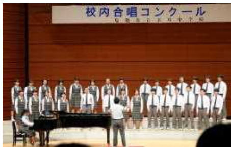
【2年3組自由曲「君とみた海」】