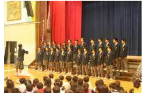
【月見ヶ丘小学校歌声交歓会 1年2組自由曲「旅立ちの時」】