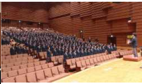
【全校合唱「ひとつになる」】