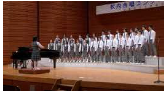
【3年2組自由曲「信じる」】

最優秀賞の1年2組は、10月15日(火)の月見ヶ丘小「歌声交歓会」で課題曲と自由曲を披露しました。また、2年3組は、11月1日(金)の玉川小「音楽集会」、3年2組は、同日に行われる「塩竈市中学校合同音楽祭」にそれぞれ出演し、最優秀賞クラスとしての歌声を響かせる予定になっています。