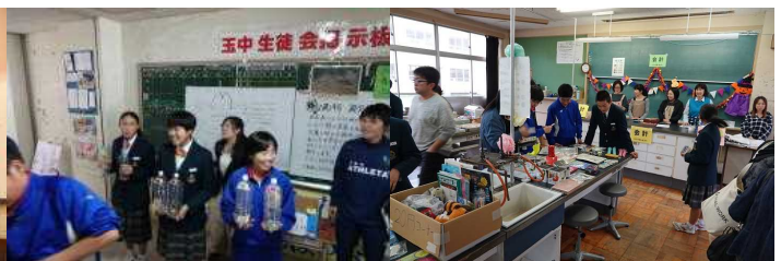
【生徒会の募金活動】