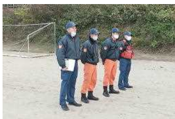
【塩釜消防署の皆さん】

今年度2回目の避難訓練を「大きな地震の後に火災が発生した」という想定で実施しました。今回は塩釜消防署から4名の消防士の方々に来ていただき、正しい避難の仕方、消火器の使い方について指導を受け、6名の生徒と2名の教員が、実際の消火器を使って初期消火訓練を行いました。