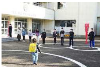
【月見ヶ丘小での活動】

生徒会執行部員が2つの小学校であいさつ運動を行いました。今年度は児童生徒間の交流がなかなかできなかったのが、大変よい機会になりました。小学生の皆さんが元気よくあいさつを返してくれるので、すがすがしい気持ちになりました。